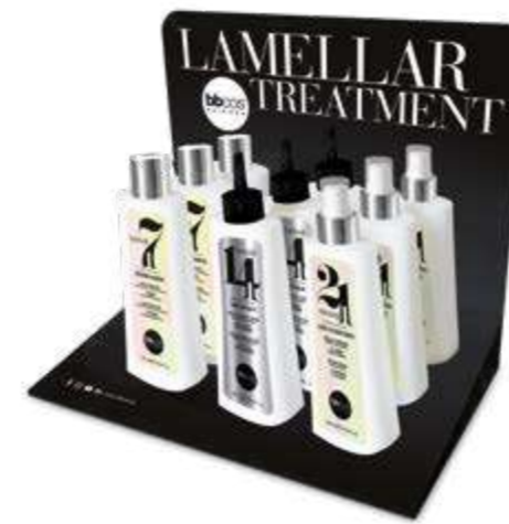
ESPOSITORE DA BANCO trattamento lamellare