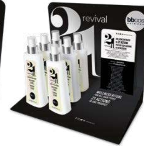
ESPOSITORE DA BANCO 21 in 1 da 250 ml