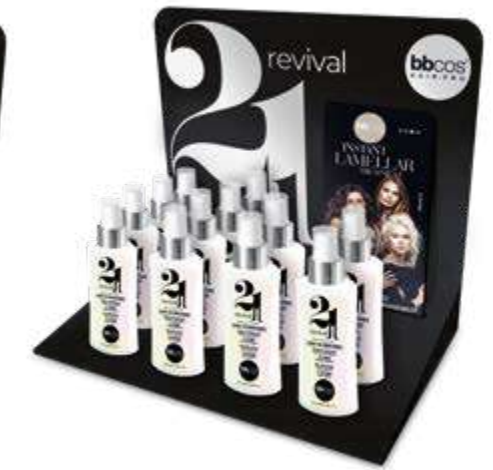
ESPOSITORE DA BANCO 21 in 1 da 100 ml